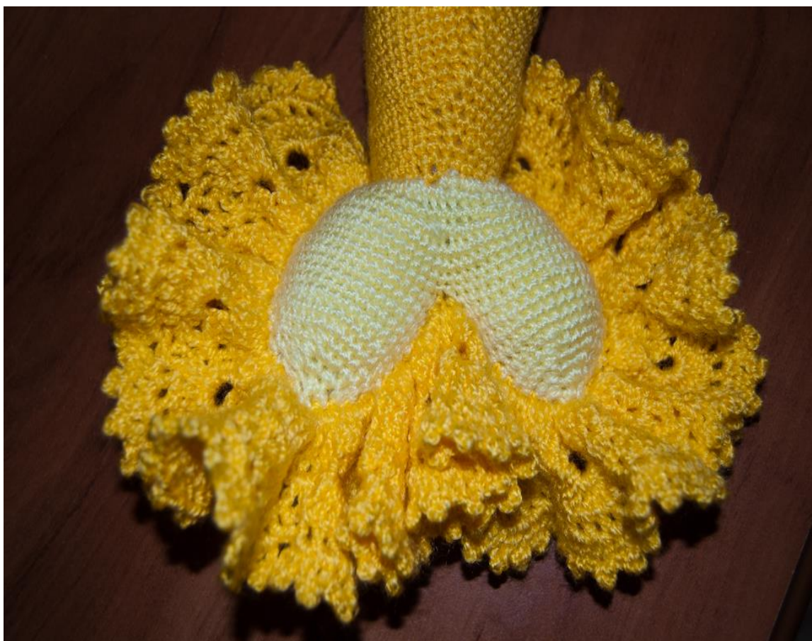
Кружево крупным планом.