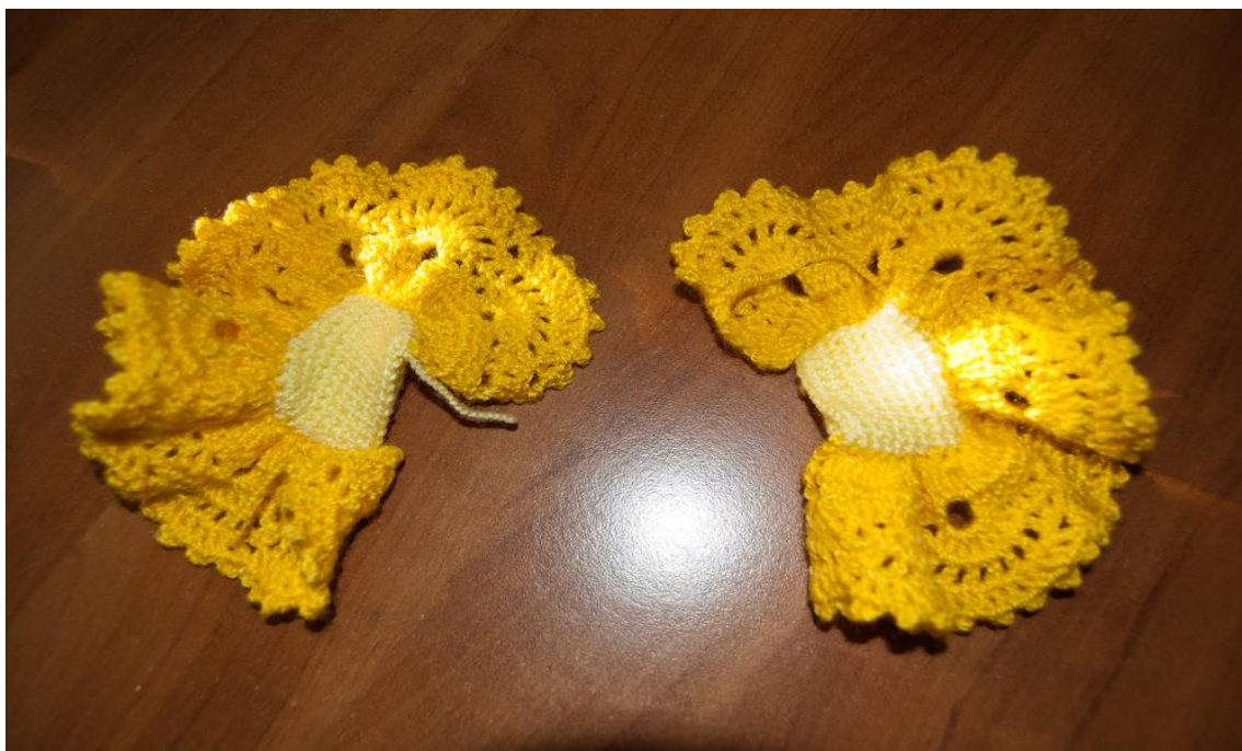
Хвостик с кружевом: