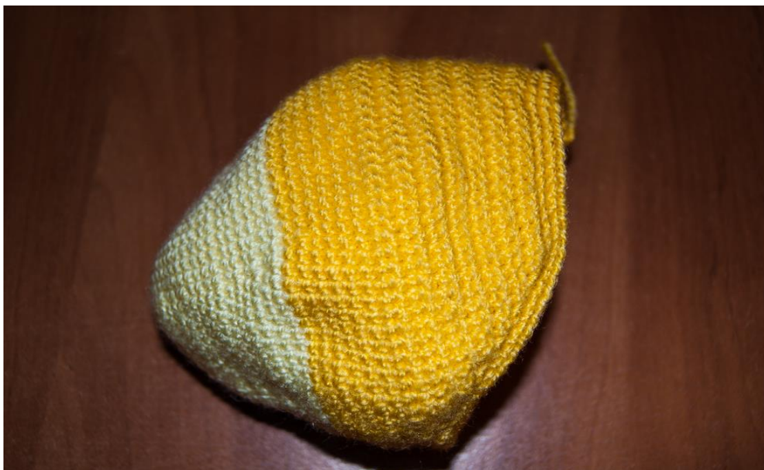
Вид снизу, с "живота"