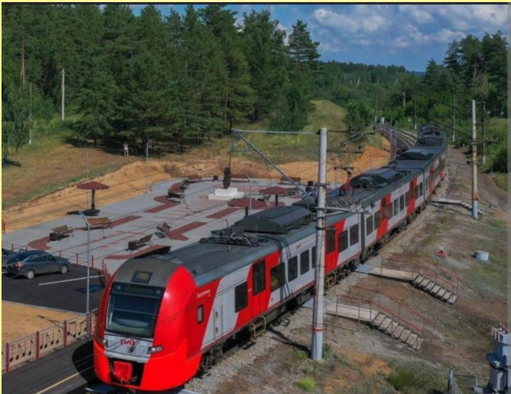
Платформа Валерия Грушина