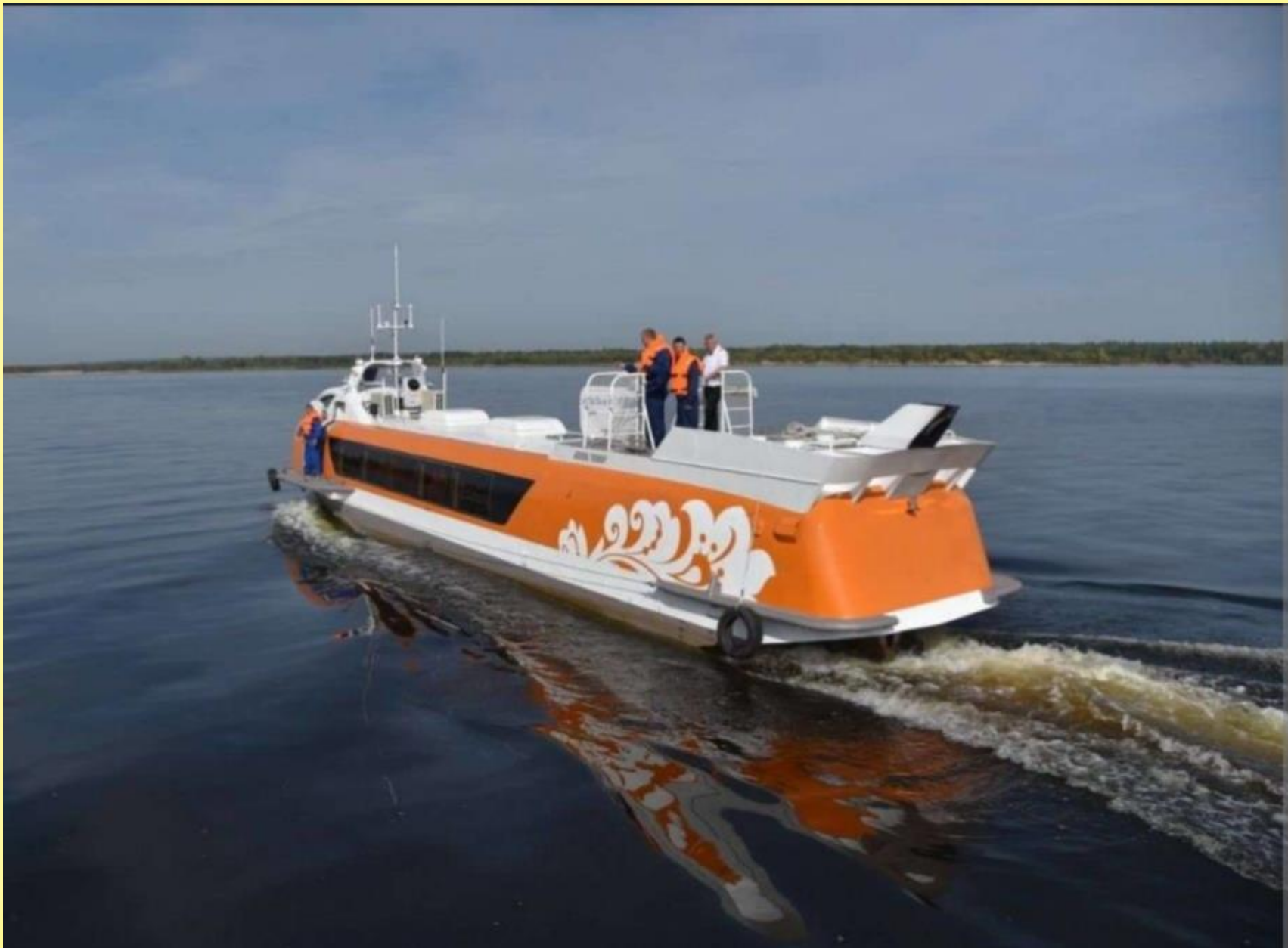
«Валдай – 45 Р», названный в честь погибшего студента.