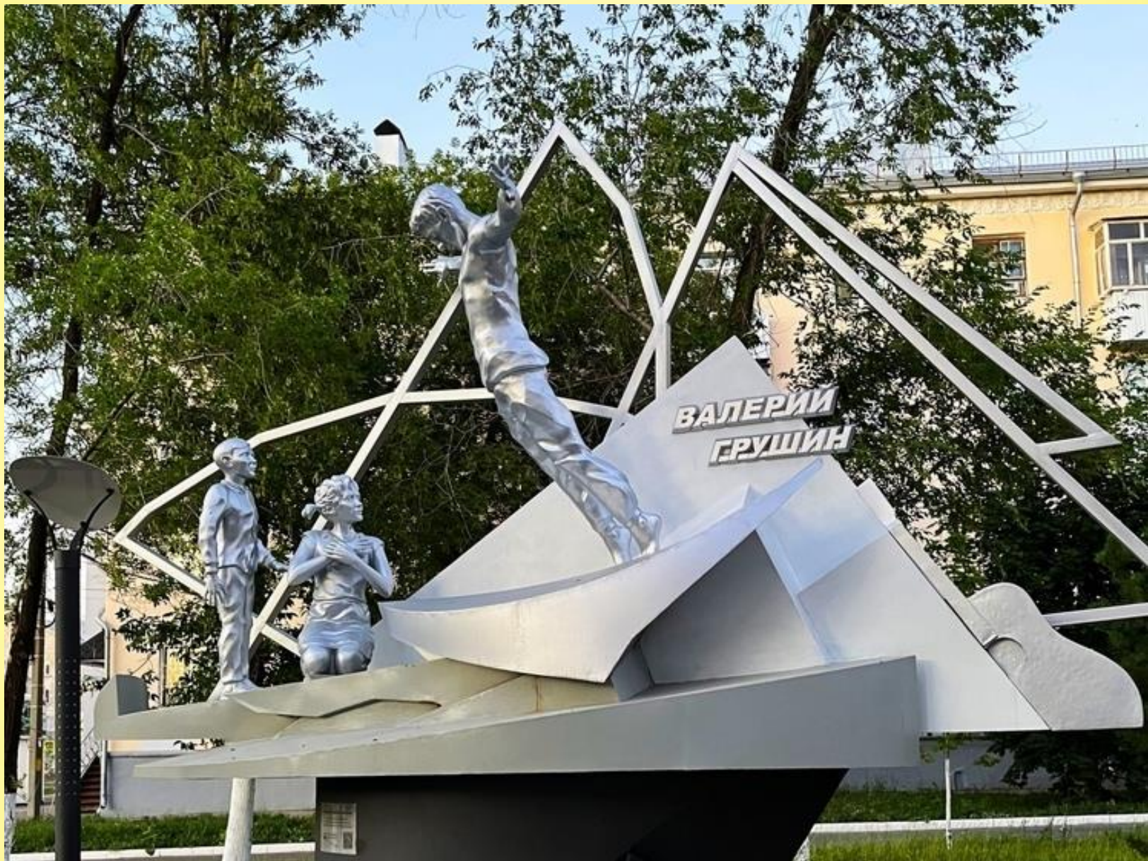
Новокуйбышевск. Сквер Валерия Грушина.