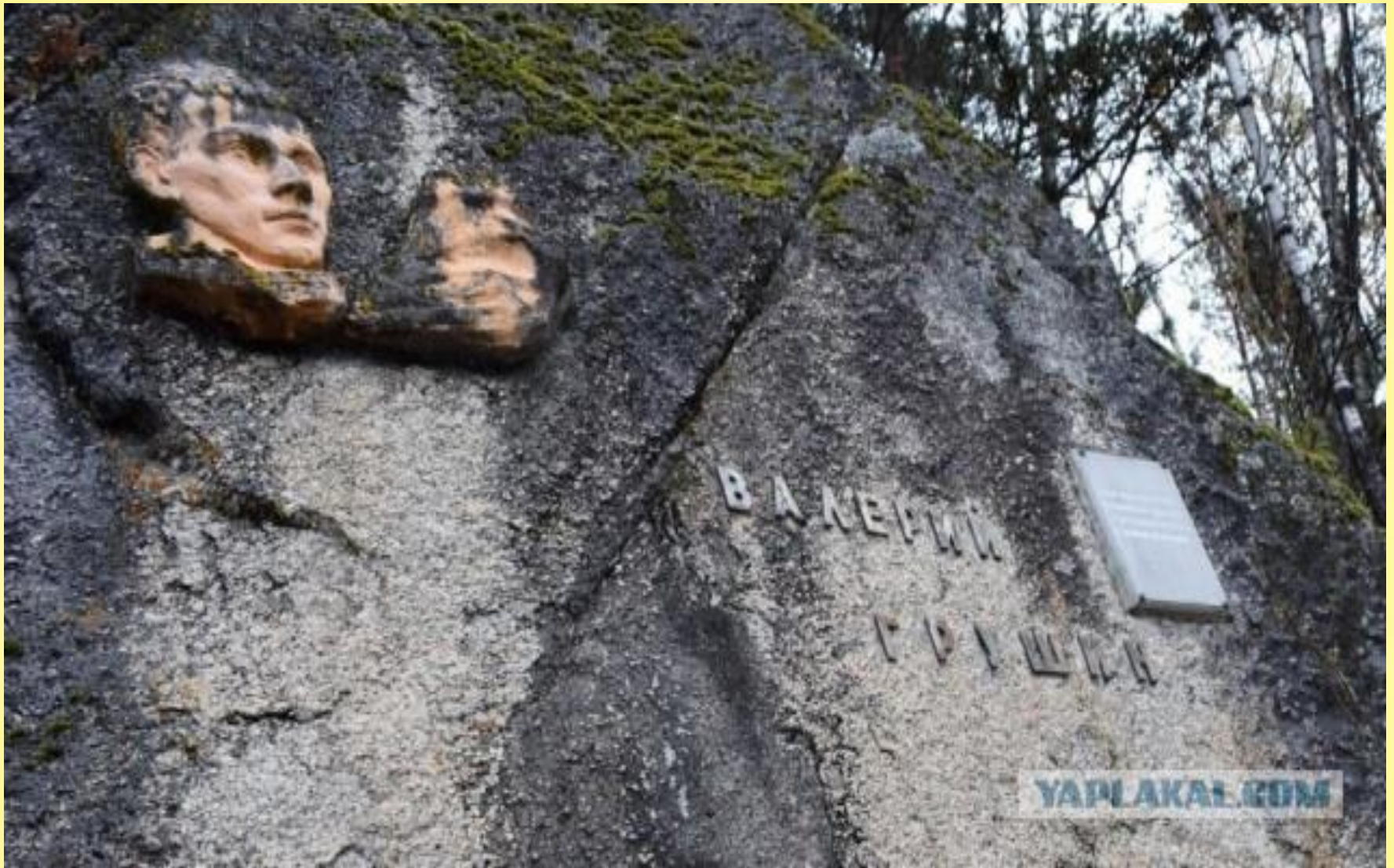
Барельеф на месте гибели Валерия Грушина.