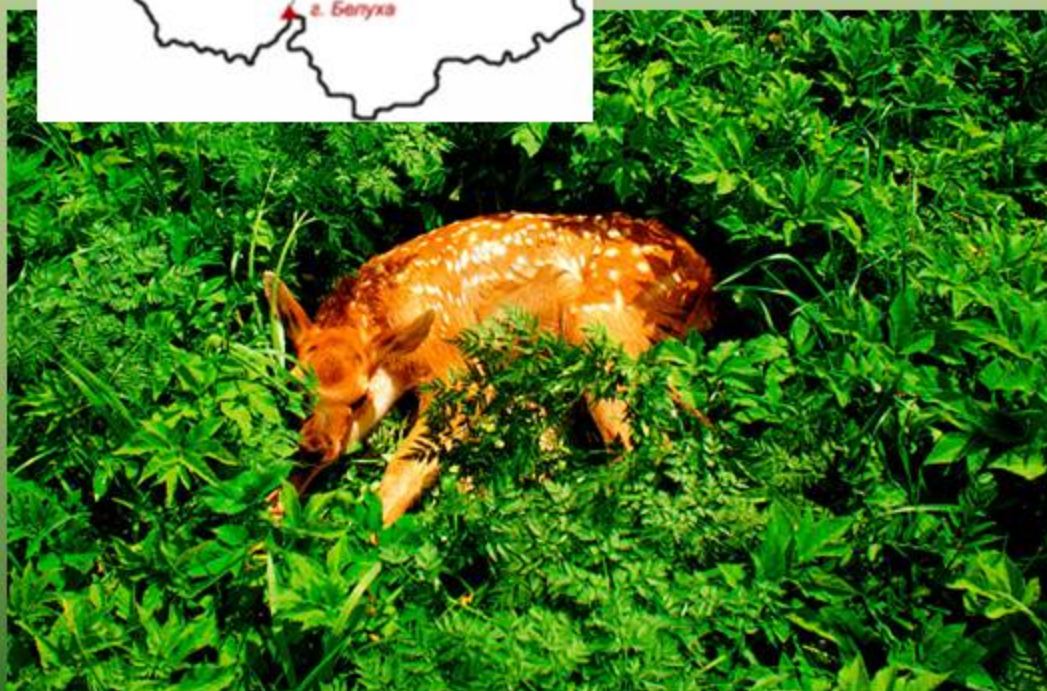
Алтайский мараленок (благородный олень)